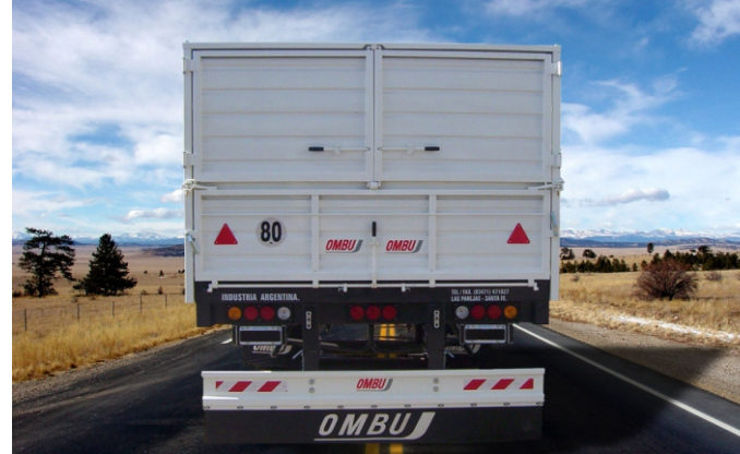
Puertas traseras tipo cerealeras.