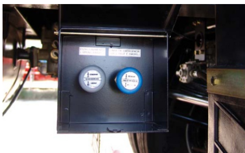
Comandos de frenos. Dispositivo para accionamiento manual de bloqueo y desbloqueo.