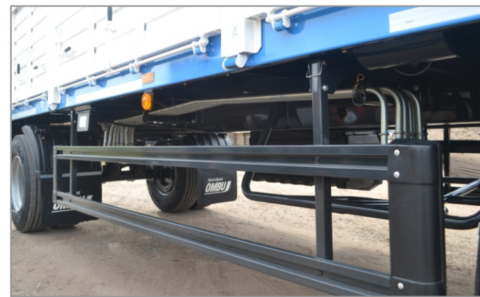
Posición opcional (consultar)