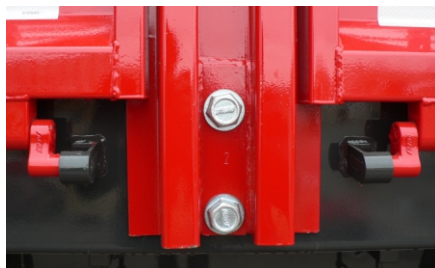
Parantes desmontables y ajustables con bulones de rosca de avance rápido.