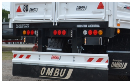
Paragolpe rebatible, volcable y desmontable. Sistema de luces de led y lámparas.