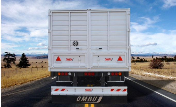
Puertas traseras tipo libro con troneras.