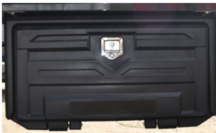
Cajón de herramientas plástico.