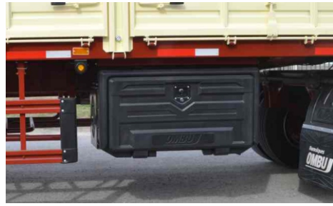
Cajón de herramientas lateral.