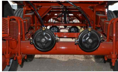
Sistema de frenos a campana 8" Qmax.