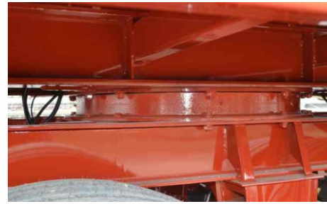
Aro giratorio: con doble hilera de bolas