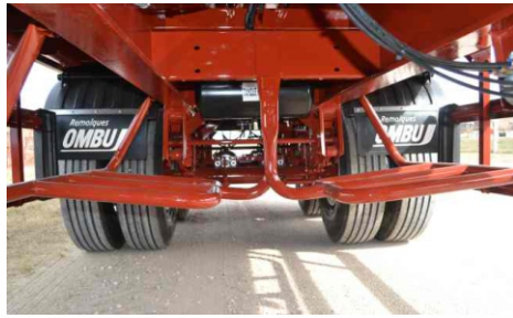
Porta auxilios inferiores