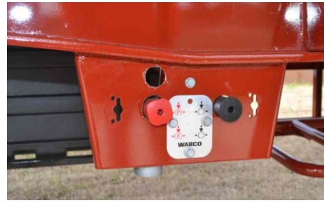
Panel de control de frenos