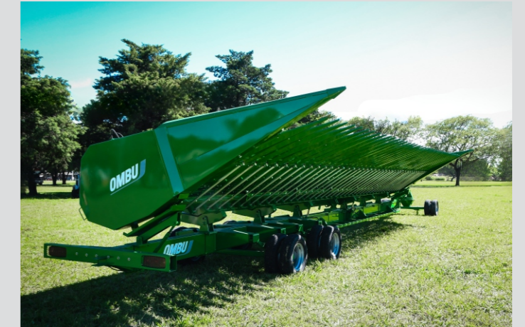
CABEZAL GIRASOLERO CG 2010. Adaptable a cualquier tipo de cosechadora mediante embocador abulonado.