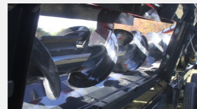
EmboCADores cambiables totalmente abulonados, para uso con cualquier tipo de cosechadora.