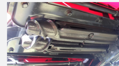
Rolos de fundición nodular en voladizo.