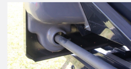
Mando de sin fin independiente del mando de cajas con 2 velocidades disponibles.