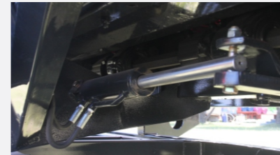
Movimiento de chapas cubre rolo móviles hidráulico de serie regulables desde la cosechadora.