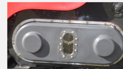
Transmisiones de cajas con 3 velocidades disponibles.