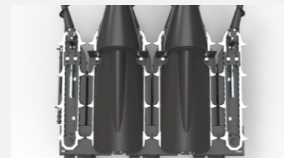
Cadenas alzadoras CA 555.