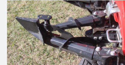
Cuerpos recolectores con Rolos entregadores con velocidad mayor a las cadenas alzadoras.