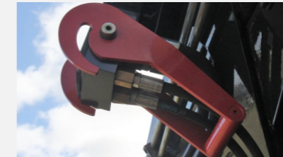
Acople hidráulico opcional dependiendo de la marca de cosechadora.