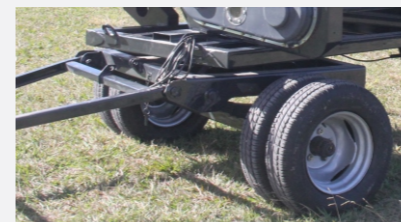
Carro con avant tren del largo del cabezal y lanza rebatible ocupando un mínimo espacio en galpón o carretón. 14 surcos 2 ejes, 16-18-20 surcos 3 ejes.