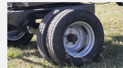
Rodado 14" para calzar neumáticos 185 R14 duales.