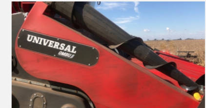
Rolos laterales superiores para encauce de plantas de serie con transmisión hidráulica y velocidad regulable desde la cosechadora.