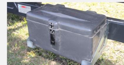
Cajón plástico para el traslado de engranajes de cambio de velocidad abulonado al carro de transporte.