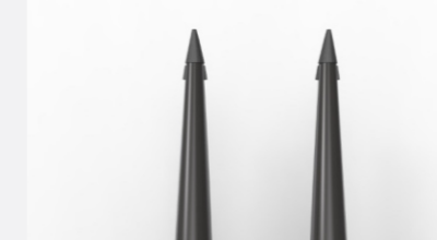
Punteras de acero con base de roce en acero Hardox resistente al desgaste de serie.