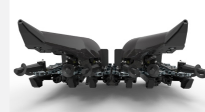
Puntones cónicos bajos y canal de entrada amplio para varias plantas.