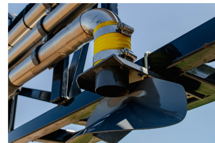
Picos Difusores: hasta 18 picos difusores de acero inoxidable marca ALTINA, para distribución de productos sólidos en cobertura total.