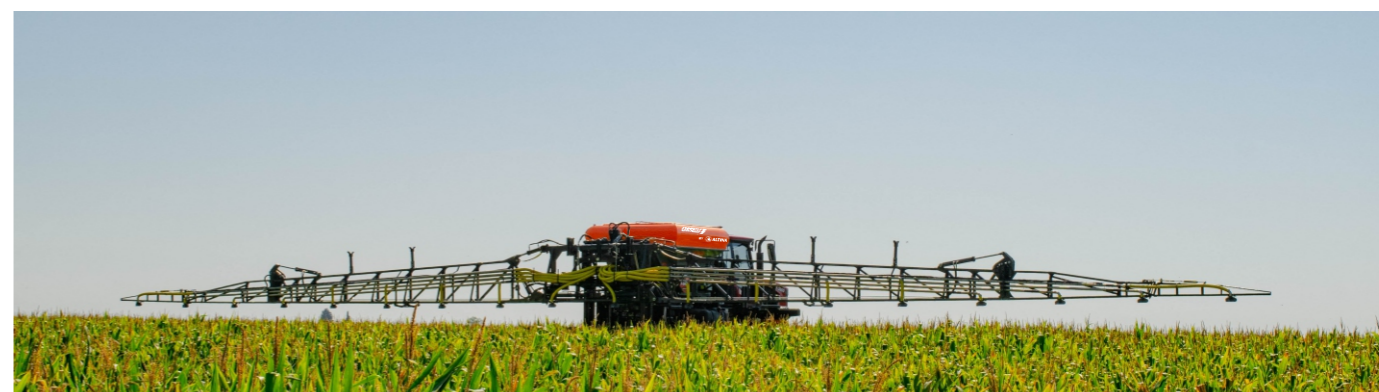
Ancho de Labor Máximo: 32 metros (A elección del cliente).