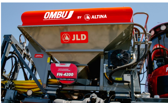
Tolva de acero inoxidable. Presurizada con removedor y criba anti-terrón. Con divisor de caudal de sólidos para mejor distribución del material dentro de la tolva. Evita derrames fuera de la misma.