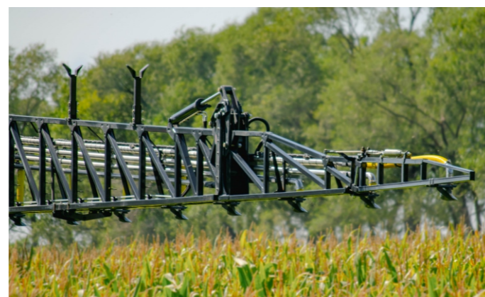
Caños conductores de acero inoxidable.