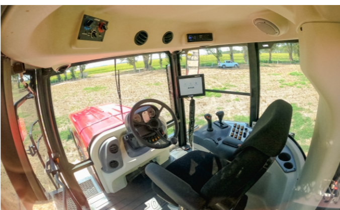
Amplia y confortable cabina , con equipamiento de guiado satelital y balanza referencial.