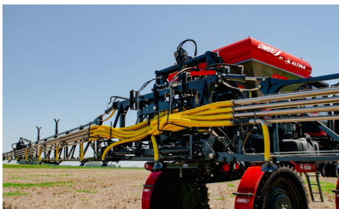
Dosificación Variable por mapeo, georeferenciada, o manual.