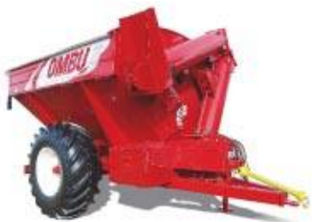
ATA 10 Ton

< PARAGOLPE TRASERO De gran porte, reforzado. El mismo es móvil y desmontable para facilitar su uso. < INSTALACION ELECTRICA Constituida por luces de posición, indicadores de giro y luces de stop. Cuenta con un reflector en la parte superior del tubo de descarga y además está provista de 2 triángulos reflectivos.