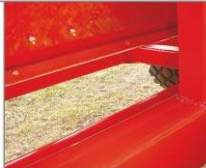
Base del sinfin horizontal totalmente abulonado para facilitar su recambio