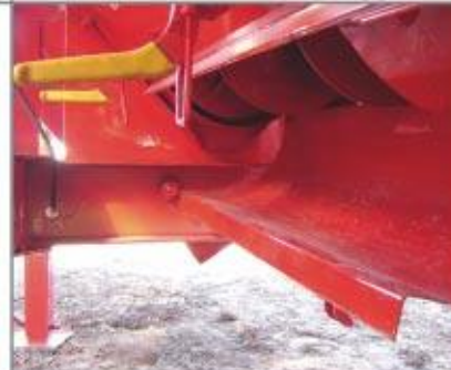
Como opcional se provee a la base del sinfin horizontal con sistema de desenganche rápido (sistema patentado OMBU), lo que evita el estancamiento de agua y desechos, facilitando la limpieza de la tolva para casos de acarreos de distintas variedades de granos. Imprescindibles en recolección para sembreros.