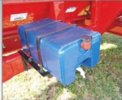
> Tanque de Agua y Caja de Herramientas (Opcionales)