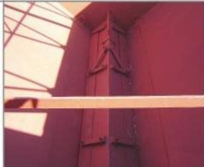
Riendas interiores de sustentación; enganches internos para elevación y guillotina de regulación.