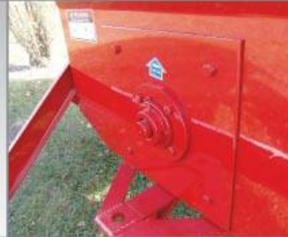
Enganche trasero y tapa de bancada del sinfin horizontal ambos desmontables