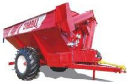
ATA 12 Ton