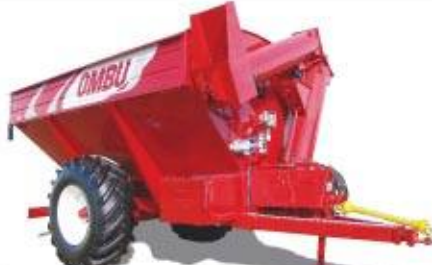
ATA 14 Ton