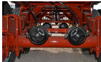
Sistema de frenos a campana 8" Qmax.