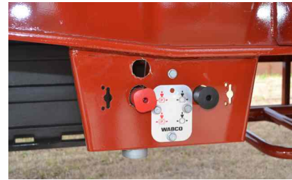
Panel de control de frenos