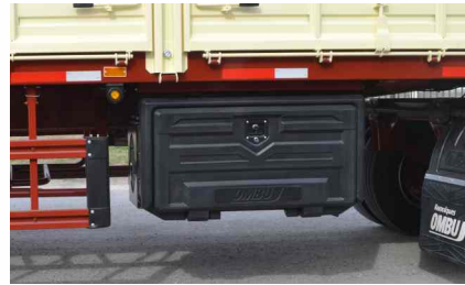
Cajón de herramientas lateral.