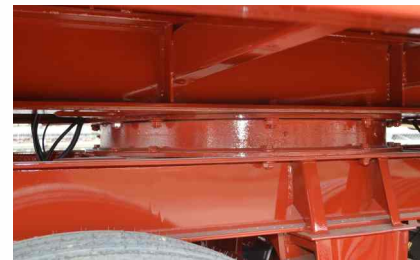
Aro giratorio: con doble hilera de bolas